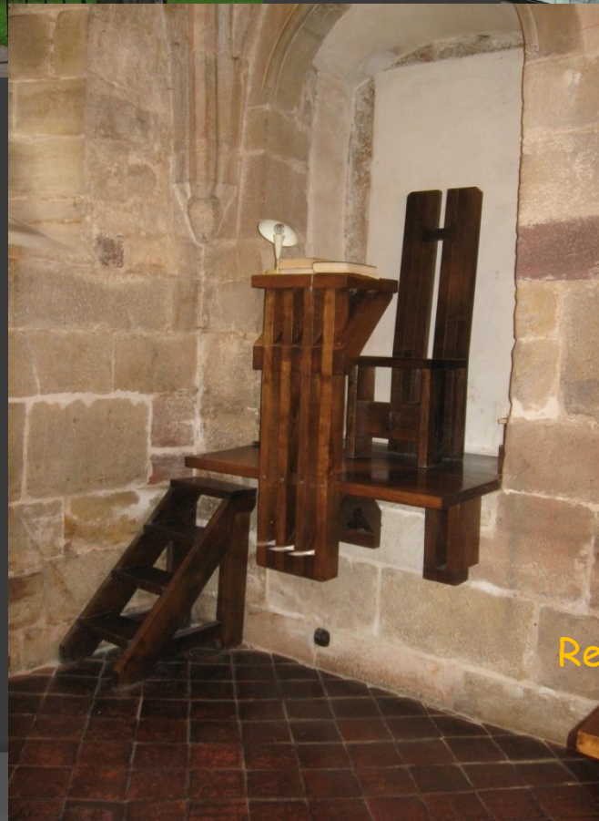
Refektarz - miejsce do czytania w czasie posiłków