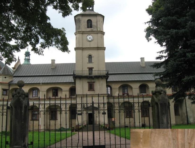
Opactwo cystersów w Wąchocku