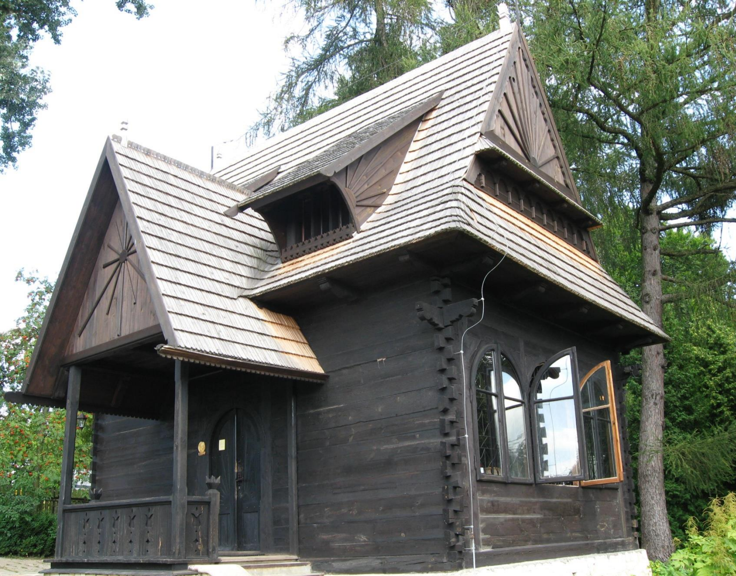
Chata Stefana Żeromskiego, wybudowana za honorarium otrzymane za powieść „Popioły”, była letnim domem pisarza w Nałęczowie