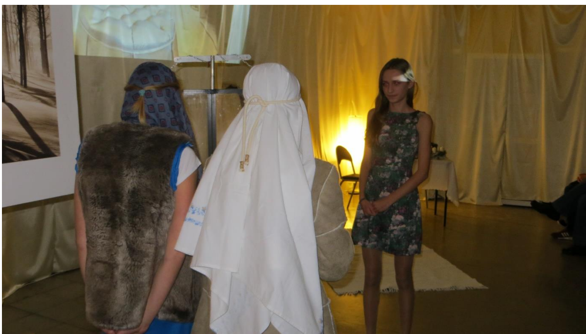
Józef z Maryją w scenie II