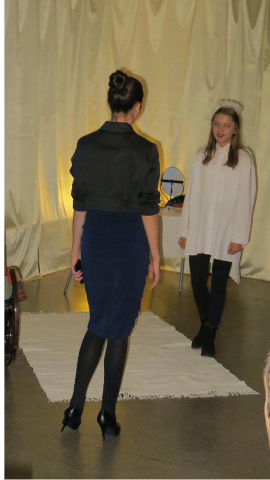
Scena III Chciwość.