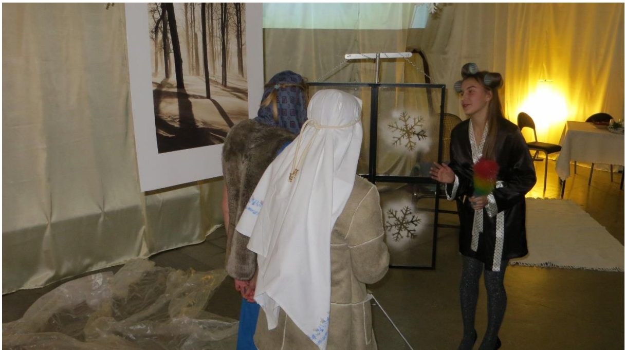
Scena V Zazdrość