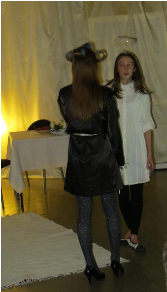
Scena IV Nieczystość