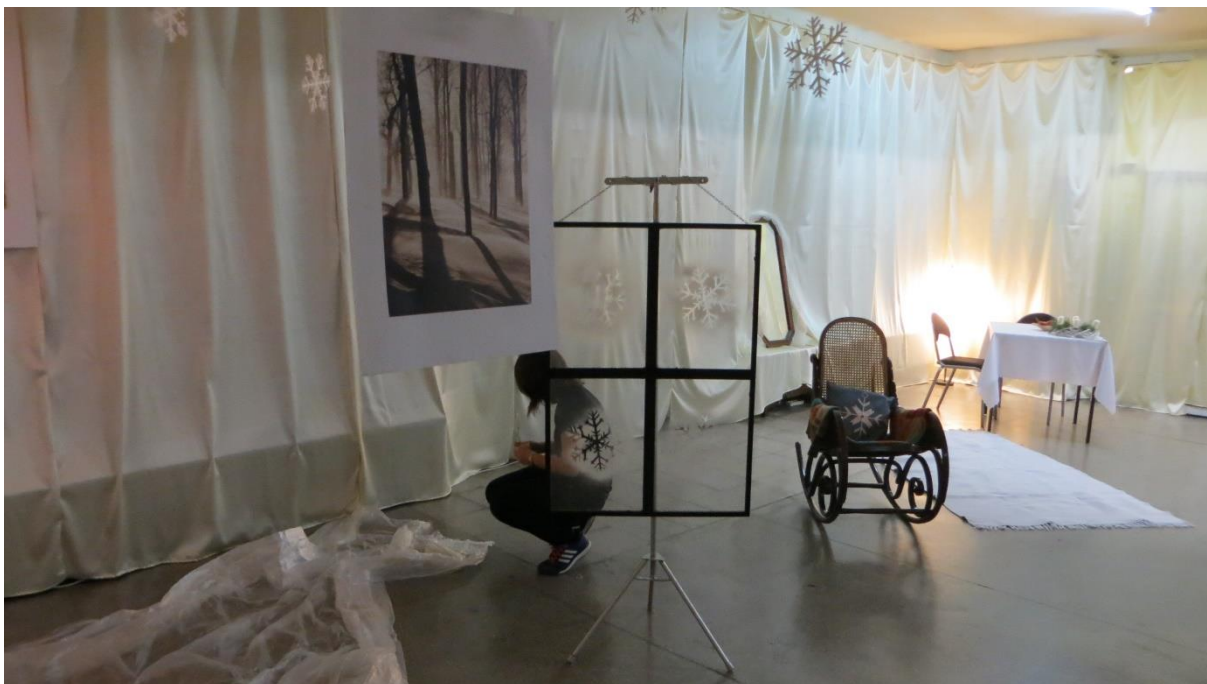
Ostatnie poprawki scenografii.