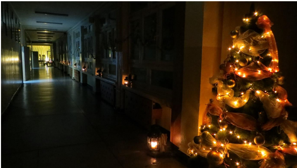
Szkoła przygotowana na przyjęcie gości.