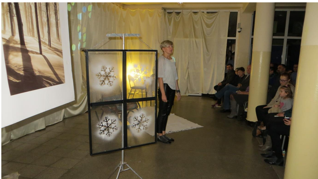
Prezentacja czas zacząć.