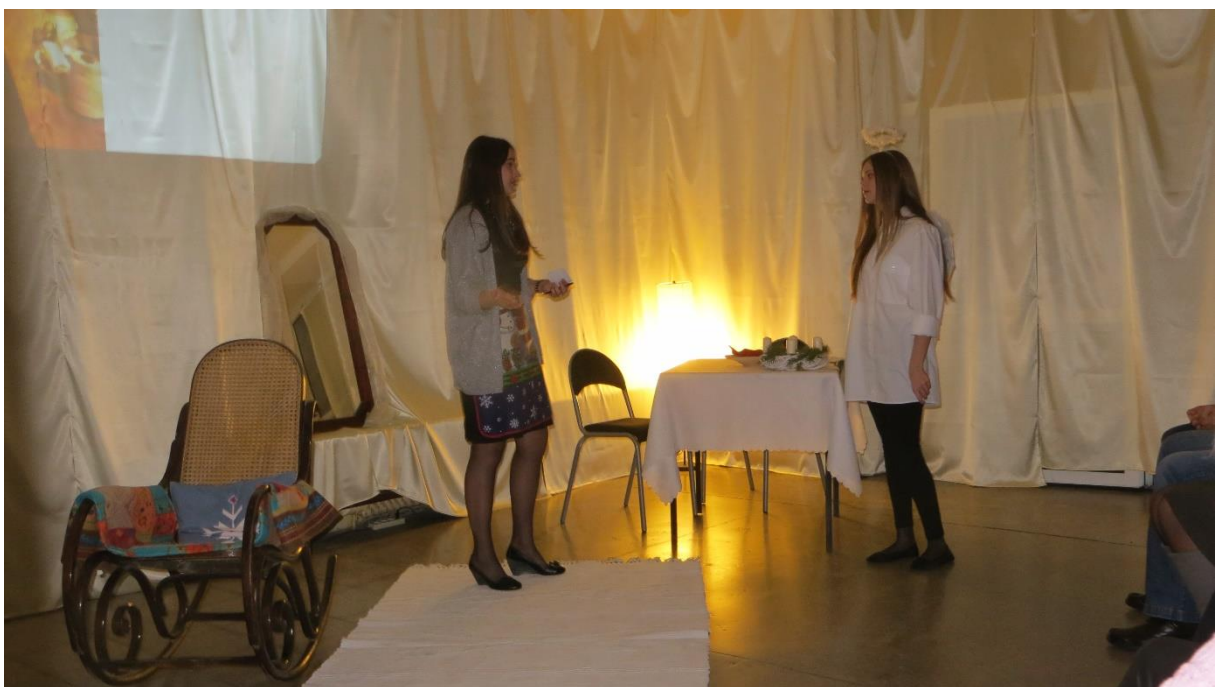
Scena VI Nieumiarkowanie w jedzeniu i piciu.