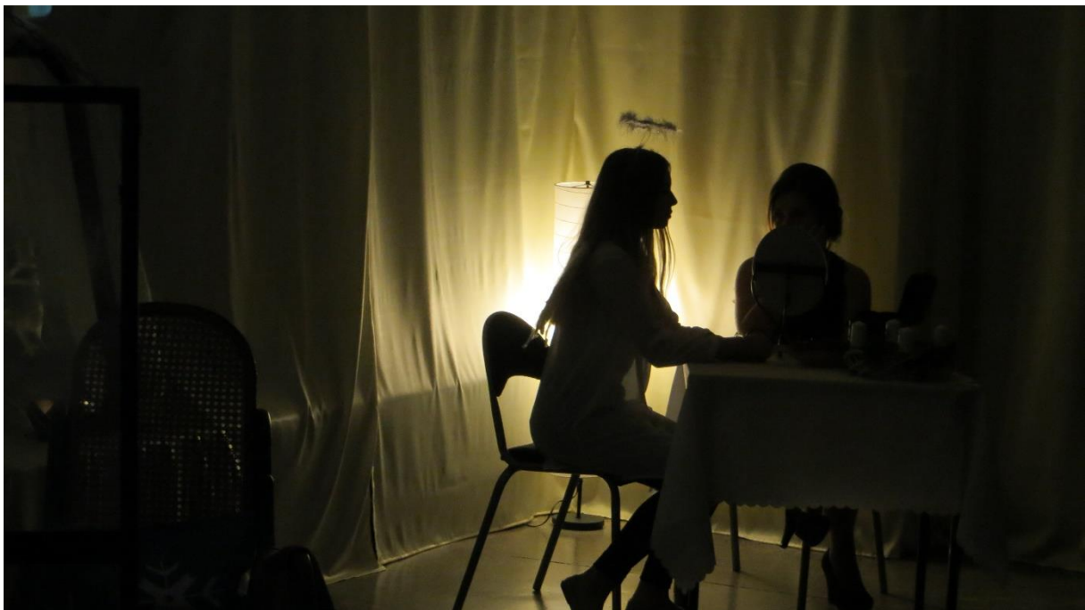
Scena IV Nieczystość