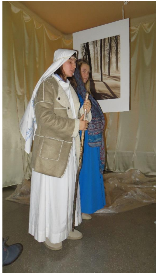
Scena VII Gniew