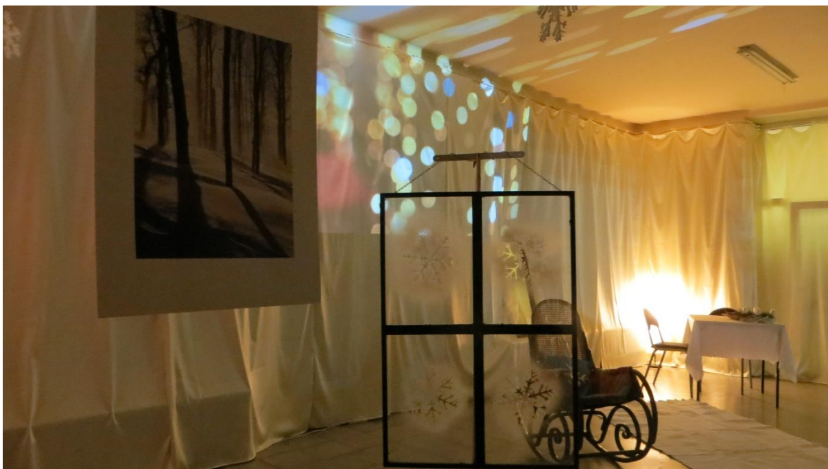
Sprawdzenie czy wszystko działa.