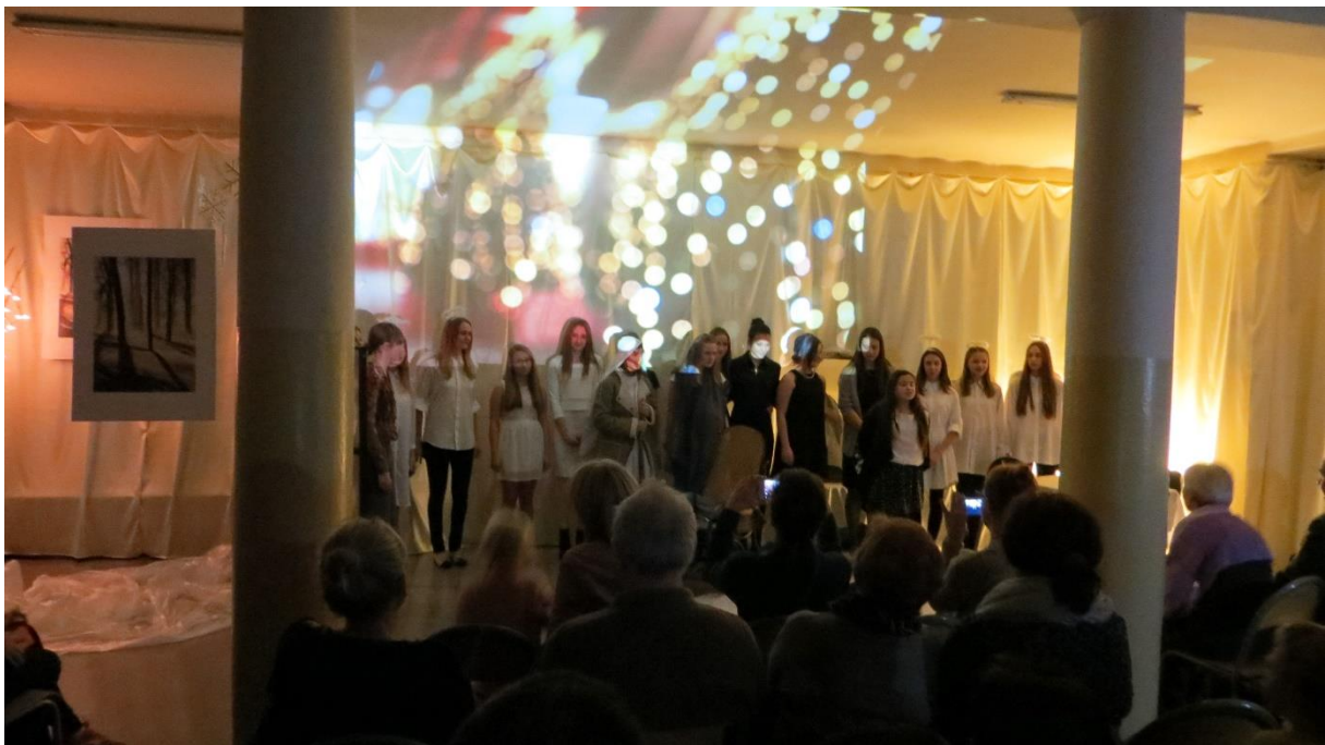
Kolęda „Cicha noc”.