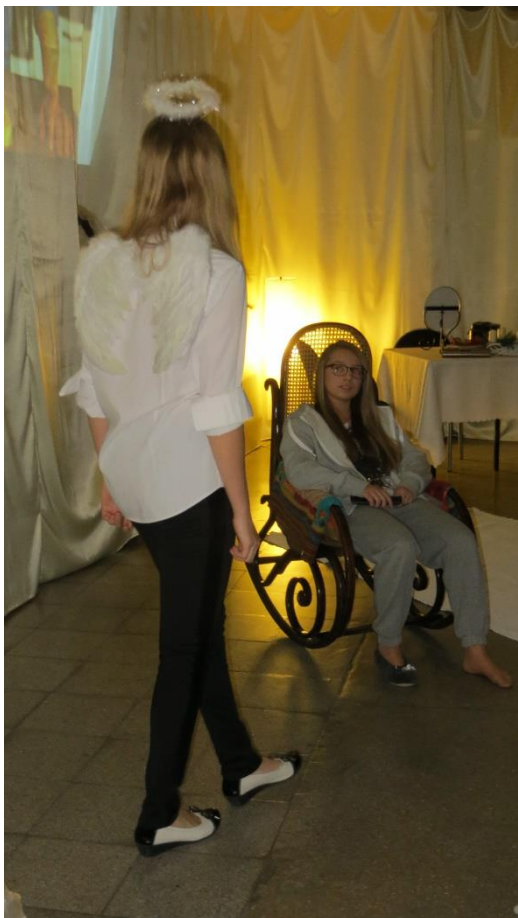
Scena I Lenistwo