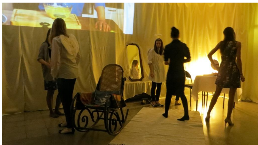
Ostatnie spojrzenie na scenę czy wszystkie rekwizyty są na swoim miejscu.