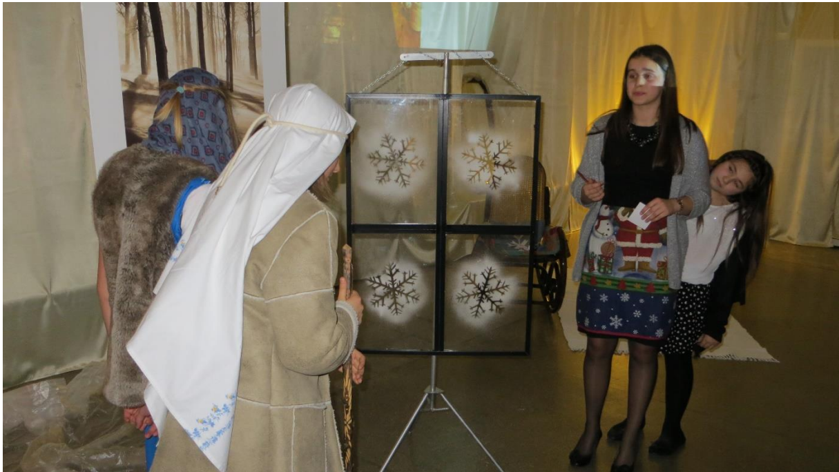
Scena VI Nieumiarkowanie w jedzeniu i piciu.